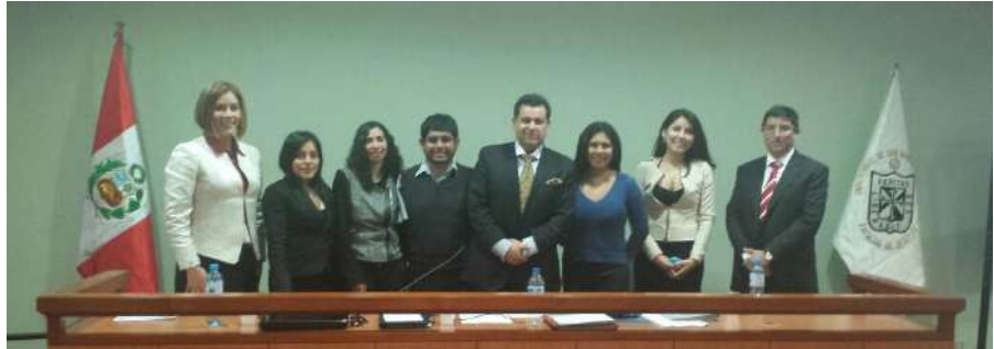
Grupo N° 26