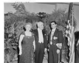
Pahlavi with US President Truman in Washington, c. 18 November 1949