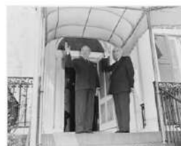
Prime Minister Mosaddegh with US President Truman in 1951

Mohammad Mosaddeq, Presidente de Irán intento a nacionalizar los yacimientos de petróleo occidentales, solo duró hasta 1953, porque un golpe de Estado incitado por la CIA lo derrocó. En su lugar ubicaron al Sha Mohammad Reza Pahlavi.