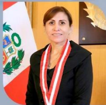
Dra. Patricia Benavides Vargas Fiscal de la Nación