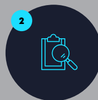
Evaluación del curriculum vitae