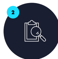
Evaluación del curriculum vitae